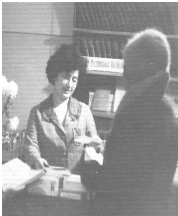
Співробітниця відділу обслуговування Харківської державної обласної бібліотеки (нині – Харківська ОУНБ). 1977 р.